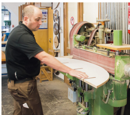
Nur noch die Kanten schleifen, verpacken und dem Spediteur übergeben