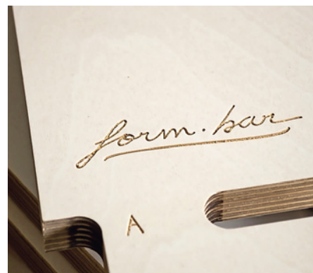
Möbel mit Namen: das elegante Form.Bar-Logo ist Teil des Fräsprogramms

Denhof für seine Rover mit Konsolentisch noch keinen Nestingstisch besorgt hat, schiebt er mit der Maus aus dem Nest heraus kleinere mit Saugern bewältigbare Einzelteilgruppen in sein CAM-Modul, das die CNC-Programme generiert. Nach der Mittagspause steht die Platte bereits an der CNC. Mit der Formatkreissäge teilt er sie grob auf, lässt die CNC-Programme laufen und schleift schließlich die Kanten an der Kantenschleifmaschine. Jetzt braucht er die Werkstücke nur noch verpacken und dem Spediteur übergeben.